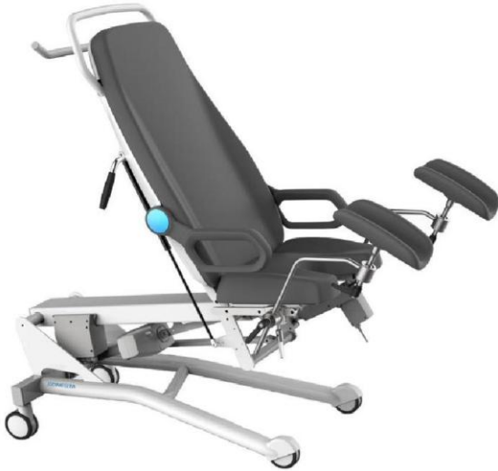
Exemplu de produs concurent