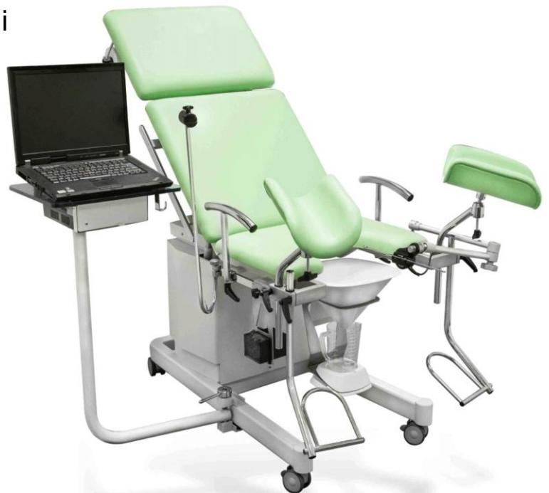
TryTable cu PC