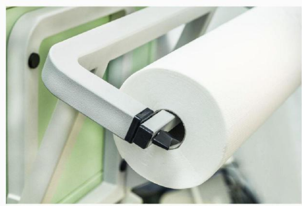
Rolă hârtie protecție